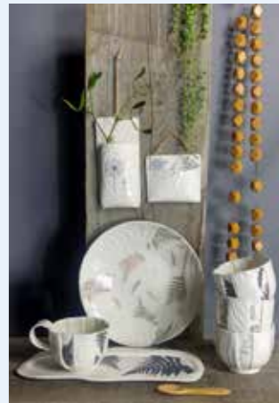
Sonja & Ricus Sebes