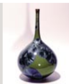
Angelika und Gerd Panten